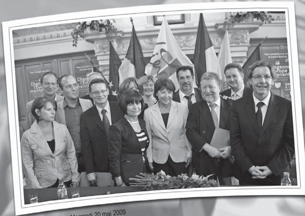
Meeting de Liévin - Mercredi 20 mai 2009

« Unité, rénovation des idées et des pratiques, rassemblement de la gauche, ce sont les tâches majeures auxquelles nous devons nous atteler » Martine Aubry, le 7 juin 2009